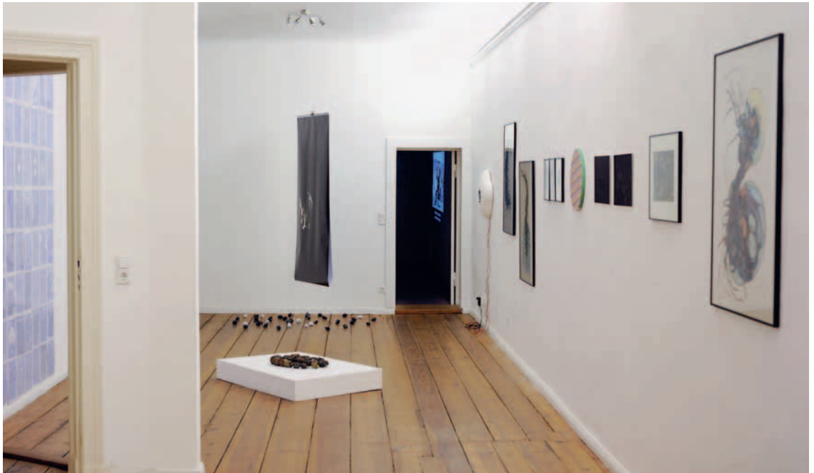
Zelle in GESTALT und der GEIST in der MUSCHEL, Raumsicht, Detail