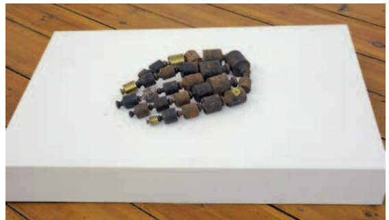
Josephine Riemann, Von schwerer Hand , Objekt, 27 Gewichtsstücke, Eisendraht Objekt 70 x 35 cm